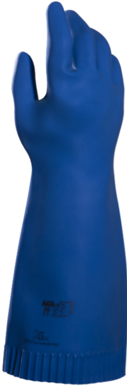
化学防护 种类 A