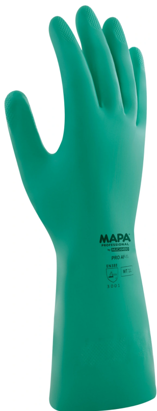
化学防护 种类 A